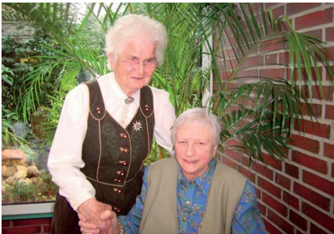
zu Besuch im Orchideen-Café